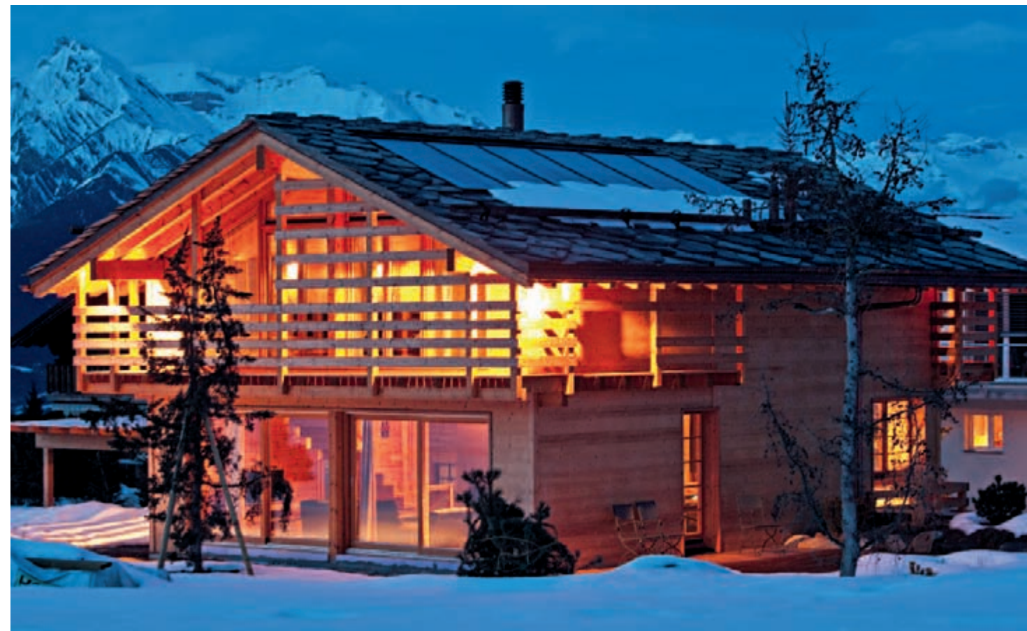
La maison est équipée d'une série de panneaux solaires thermiques permettant de produire 80% d'eau chaude et 20% de chauffage. Le gaz apporte le complément.