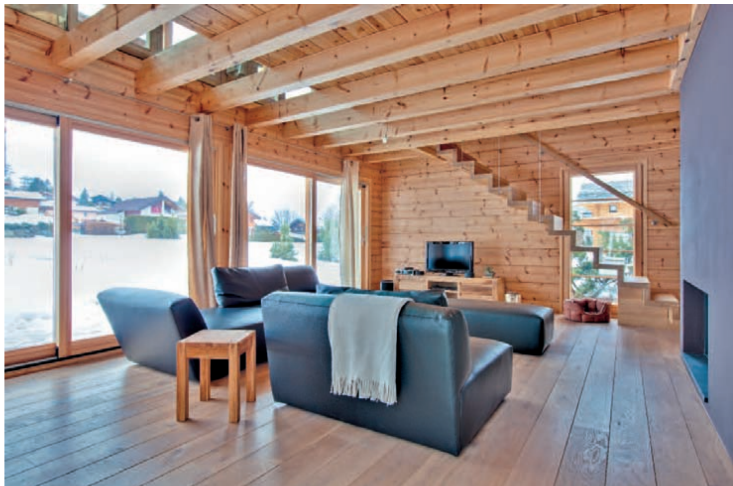
Pour favoriser la diffusion de la lumière entre l'étage et le salon, des dalles vitrées occupent une partie du plancher de l'étage. Installées le long de la façade, elles agissent comme un puits de lumière. Un élément à la fois pratique et esthétique. L'escalier est en vieux chêne.