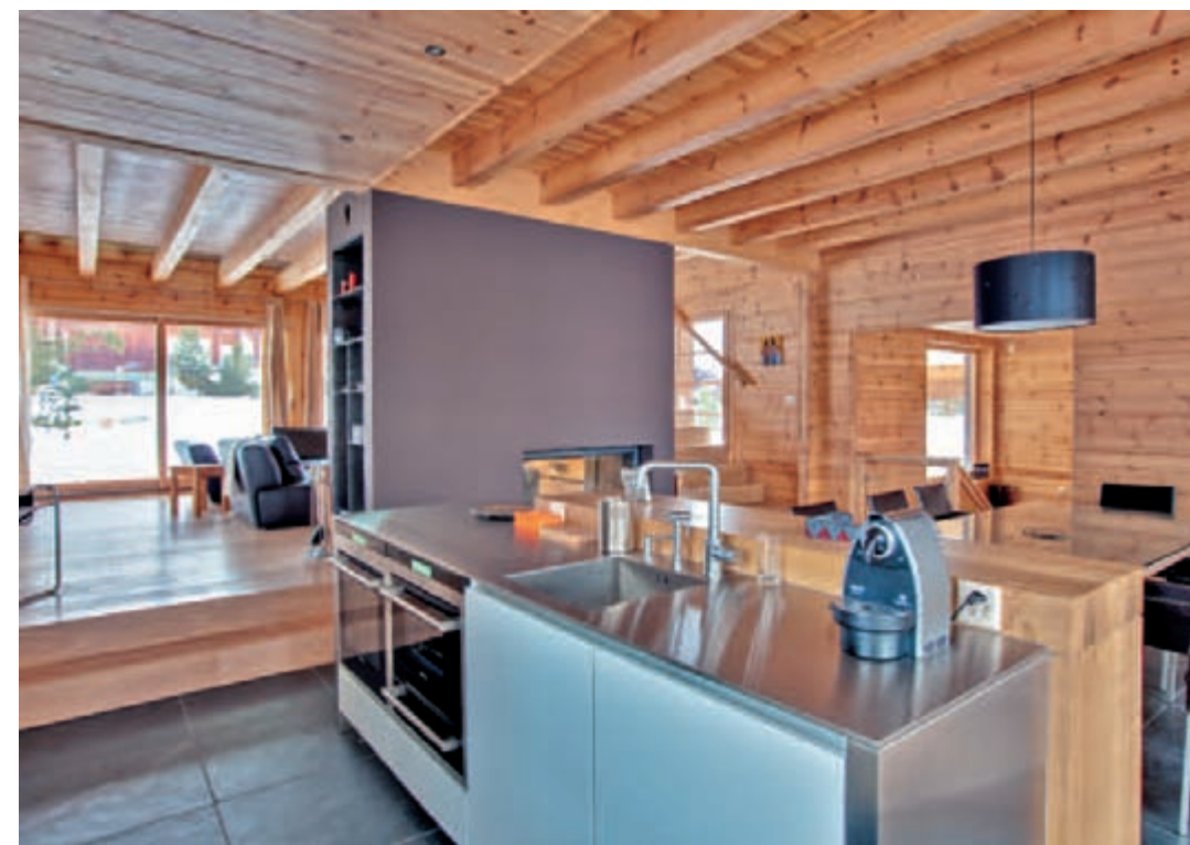
Pour ne pas rapetisser les espaces et étouffer sous le poids du bois, l'idée est d'ouvrir les volumes, de les fermer le moins possible et de les ponctuer de grandes surfaces vitrées pour les prolonger sur le dehors. Cette continuité permet de favoriser la volumétrie. Pour animer l'ensemble, des matières et matériaux différents utilisés avec parcimonie (cheminée, éléments de cuisine, ardoise) suffisent à la décoration. Très pratique pour l'entretien, le sol de la cuisine se pare de carreaux d'ardoise noire de 50 x 50 cm.

d'unir les qualités traditionnelles du bois empilé (robustesse, confort, respirabilité du bâti et régulation de l'humidité) avec les hautes performances (thermique, déphasage) de cet isolant. La paroi Fusion™ se caractérise par une structure trois plis avec le pli central placé verticalement. C'est l'une des spécificités qui joue contre le tassement, également paré grâce à une mise en œuvre qui permet un contact bois sur bois du pli central dans le sens vertical, soit celui de la plus forte compression. Pour cela, une ligne de collage spécifique a été mise en place dans l'usine Honka qui permet de produire les parois en deux épaisseurs : 128 et 204 mm. Pour rappel les bois massifs reconstitués (BMR) sont des éléments linéaires reconstitués par collage de lames de bois massifs de forte épaisseur.