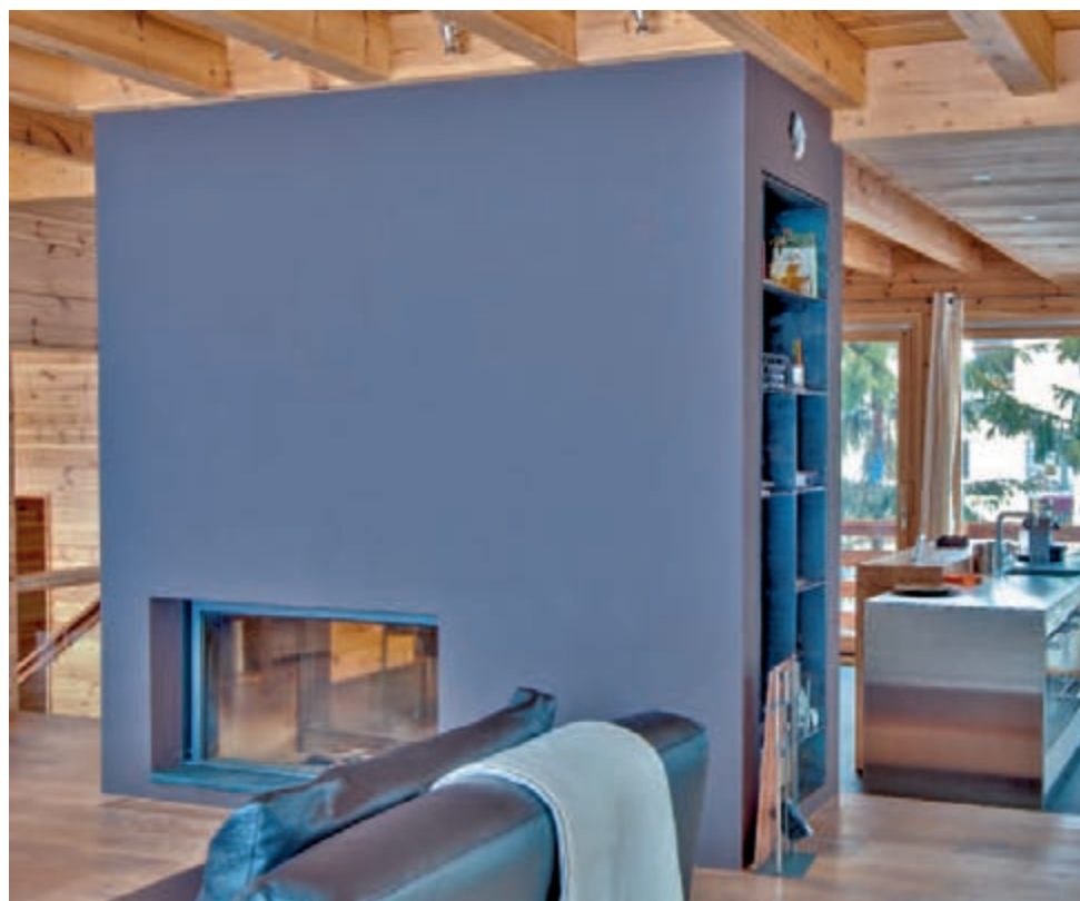
La cheminée de marque STUV est réalisée sur mesure et profite d'un habillage en crépi. Grâce à sa double ouverture traversante elle chauffe l'ensemble de la maison, mais sert également d'élément de séparation entre le séjour et le coin à manger. Centrale, elle est le point d'ancrage autour duquel gravitent les pièces de l'espace de vie.

Le constructeur a étudié cette question dès 2005 pour aboutir à la paroi Honka Fusion™ et bénéficier d'un outil de développement supplémentaire pour ses maisons. Il s'agissait de produire un bois massif reconstitué non tassant et de l'associer à un isolant en fibre de bois. Au final, cela permet