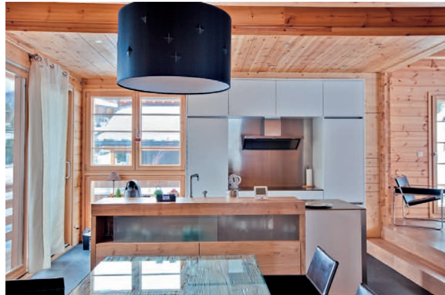
Les meubles sanitaires et de cuisine ont été créés sur mesure selon les dessins et plan de Jean-Michel Martignoni et exécutés par des artisans locaux (Lathion Frères) à Nendaz en Suisse. Le confort moderne est présent : four à air chaud, steamer, réfrigérateur avec congélateur, plaques vitrocéramiques à induction et hotte de ventilation.

Les systèmes en bois massif sont soumis à des phénomènes de tassement, dus aux charges qui compressent le matériau et à la rétractabilité naturelle du bois. Face à cette caractéristique, Honka a mis au point une paroi qui se veut non-tassante. Si les constructeurs maîtrisent sans souci cette « contrainte » naturelle et anticipent ces mouvements pour éviter les problèmes constructifs et assurer le bon fonctionnement des équipements (portes, fenêtres, escaliers), la société finlandaise a souhaité innover pour faciliter la réalisation d'une construction mixte. En effet, deux parties d'un bâtiment n'évoluent pas de la même façon si elles sont réalisées selon des principes constructifs différents comme du bois empilé et de la pierre ou du bois empilé et une ossature bois. Cette innovation doit permettre de combiner les modes de construction en bois, bois massif, ossature bois et poteau-poutre et/ou d'associer d'autres matériaux de construction comme la pierre, l'acier, le verre. Une vraie évolution.